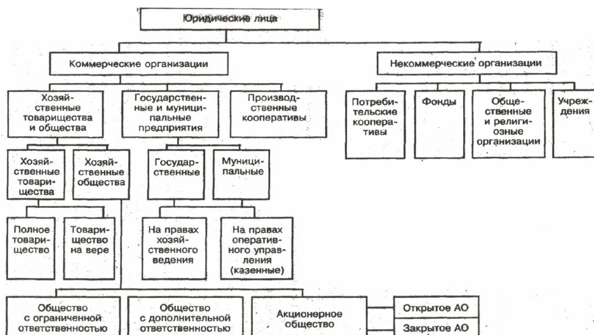
Рис. 1. Организационно-правовые формы юридических лиц в России Приложение 5